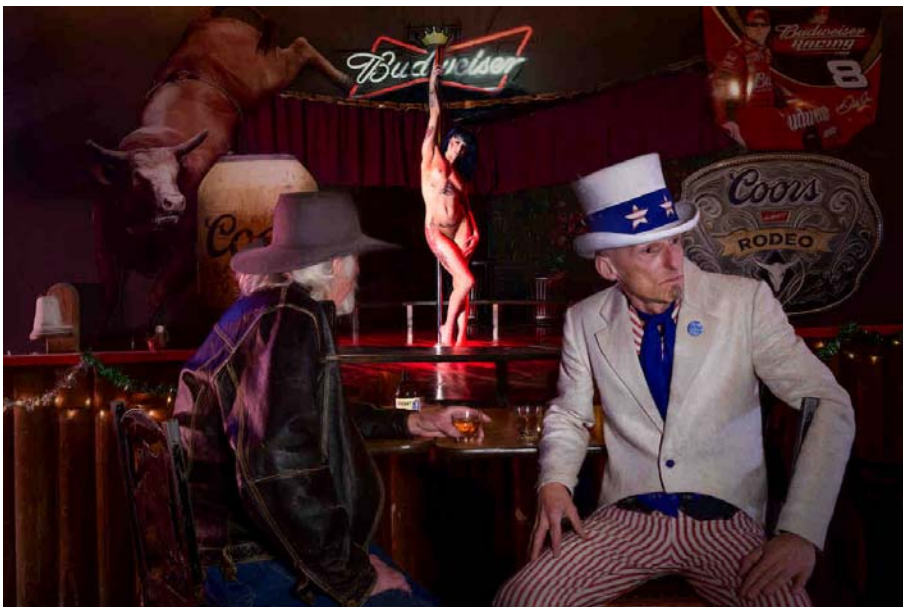
USA, Oregon, Prineville, Uncle Sam Stripper

Wirst Du die Serie noch weiterführen. Was ist damit geplant?