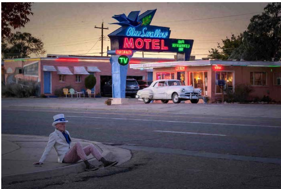
USA, New Mexico, Road Trip, Route 66, Tucumcari, Uncle Sam

Bei einigen Szenen warst Du ja auf fremde Hilfe angewiesen. Waren die Leute hilfsbereit und bereitwillig, selbst mit aufs Foto zu kommen?