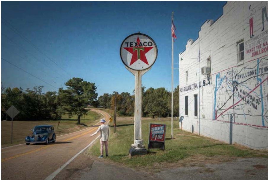
USA, Road Trip, Deep South, Tennessee, Skullbone, Uncle Sam

stilgerecht verziert. Wir wollten das historisch möglichst genau haben. Es gibt Kostüme von der Stange, welche alle gleich und billig aussehen. Es war mir wichtig dass das Kostüm echt aussieht.