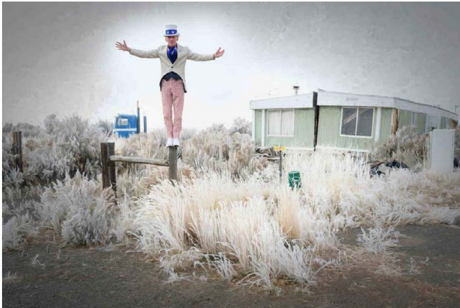
USA, Oregon, Lawen, Uncle Sam Sunday sermon

Uncle Sam ist eine Weiterentwicklung meiner American Dreamscapes, in denen ich meine Einstellung zu Amerika verarbeite. Uncle Sam hier ist wie Old Man Coyote oder der Trickster, den viele Indianerstämme in ihrer Mythologie haben. Der Trickster ist ein gutes Wesen, welches aber gerne die Leute in die Irre führt und verrückte Dinge tut. Mein Uncle Sam ist ein Spiegelbild des verrückten Amerika. Ich lebe nun schon seit 24 Jahren in Oregon und bin Doppelbürger. Aber ich verstehe die Amis eigentlich immer noch nicht. Wie sagte doch schon Asterix: «Die spinnen die Amerikaner».