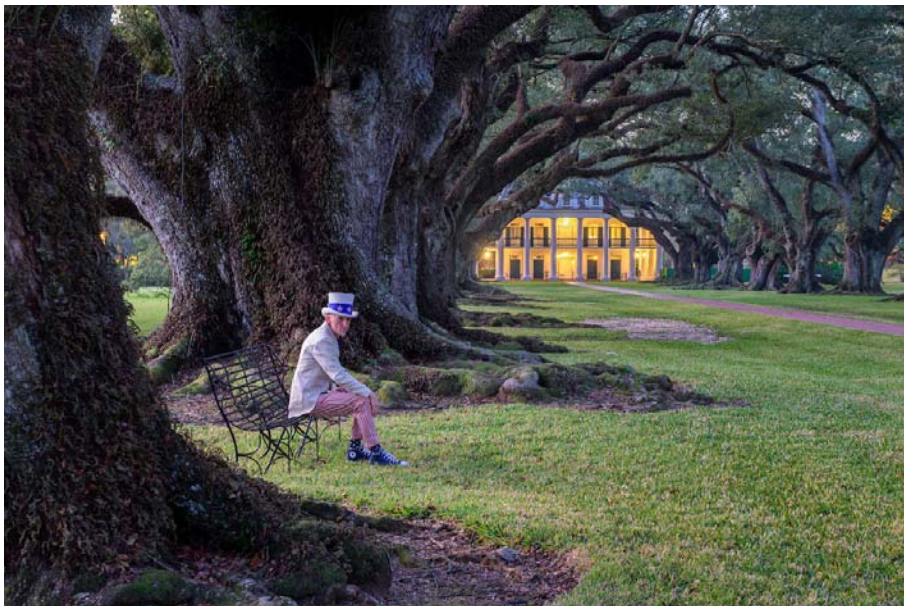
USA, Deep South, Louisiana, Uncle Sam at Oak Alley

Ich sehe in Dir die Figur von Abraham Lincoln – Du gleichst ihm auch ein bisschen. Ist das der Hintergrund der Story, eines Abraham Lincoln, der sich im heutigen Amerika kaum mehr zurechtfindet?