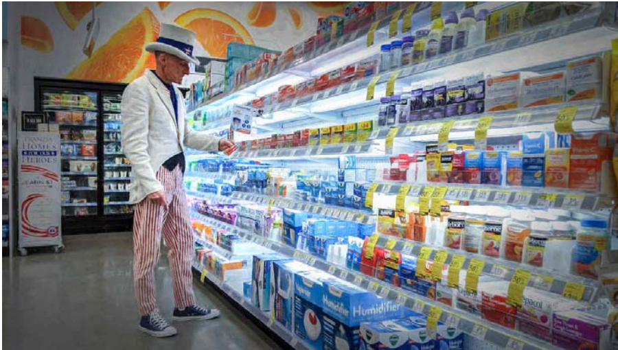
USA, Oregon, After the party