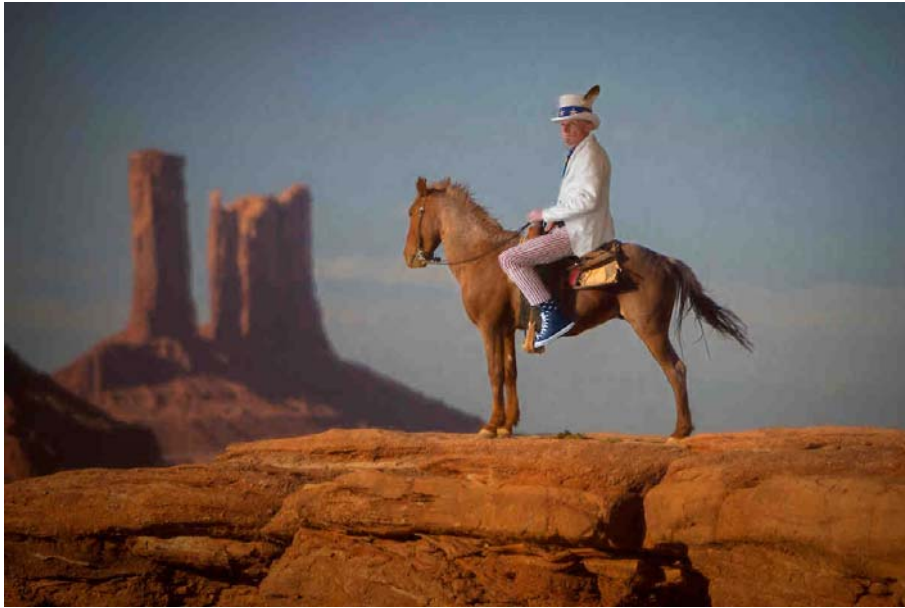
USA, Arizona, Navajo Indian reservation, Monument Valley, Tribal park