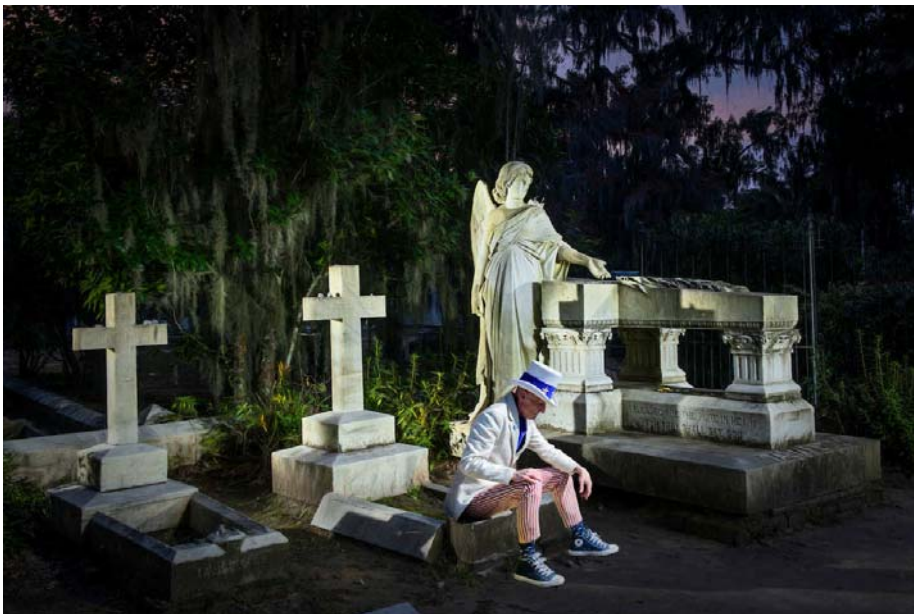
USA, Georgia, Savannah, Bonaventure Cemetery, Uncle Sam

Wie haben die Leute reagiert als sie Dich in diesem Anzug sahen?