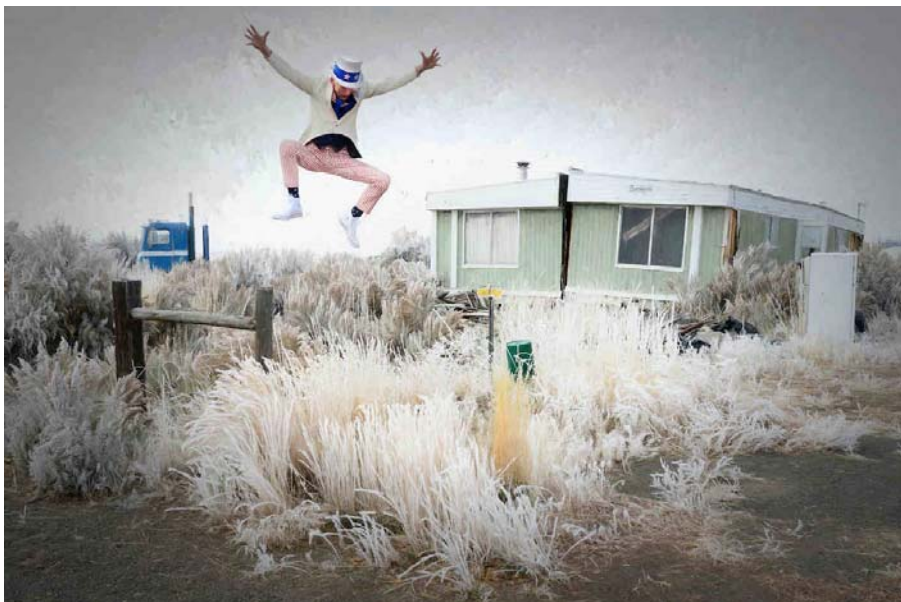
USA, Oregon, Lawen, Uncle Sam, Trickster

Das Kostüm gibt es ja kaum «von der Stange» zu kaufen. Hast Du das extra anfertigen lassen?