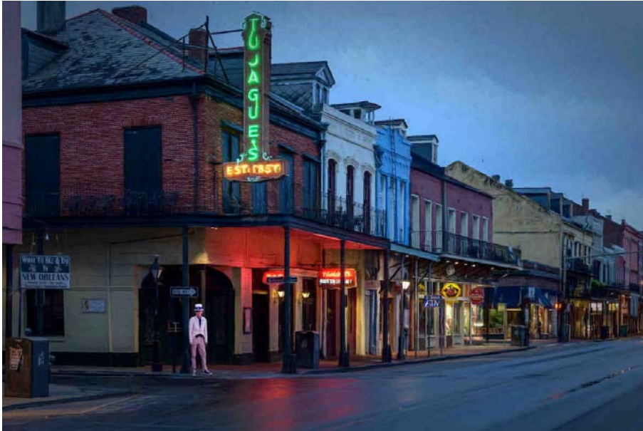
USA, Deep South; Louisiana, New Orleans, French Quarter, Lonesome Sam