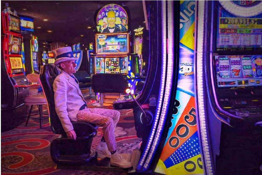
USA, Nevada, Las Vegas, Uncle Sam in Casino