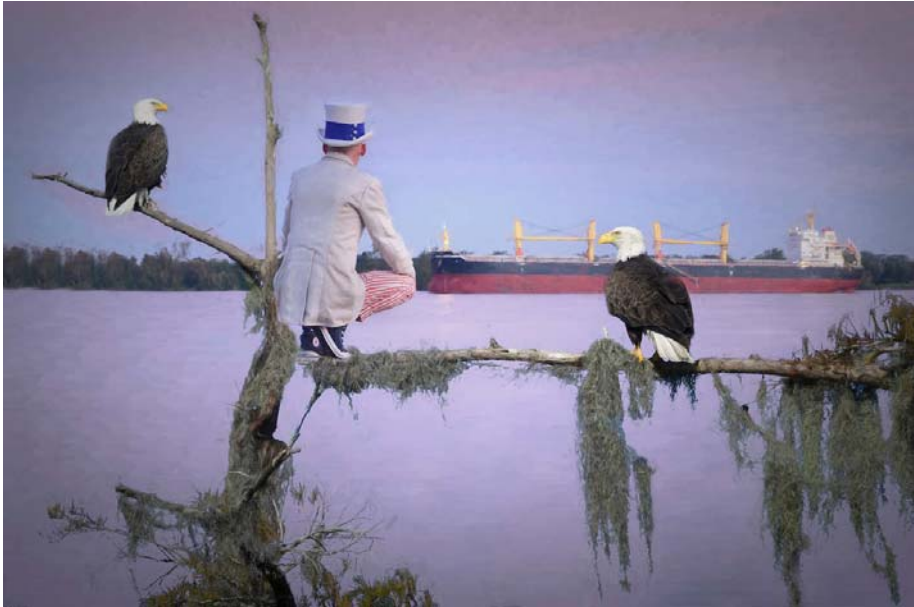
USA, Deep South, Louisiana, Uncle Sam at Mississippi River